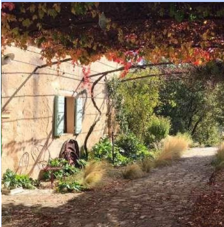
La bastide / La pergola