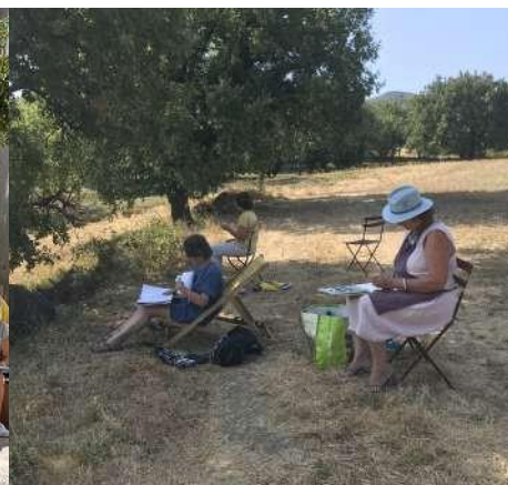
Prendre la main et transmettre

L'enseignement Croquis de Jardin permet de révéler et de développer la personnalité graphique de chacun et ce quel que soit son niveau.