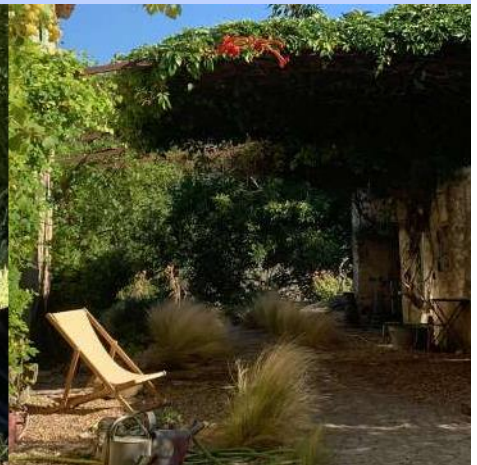
Devant la bastide