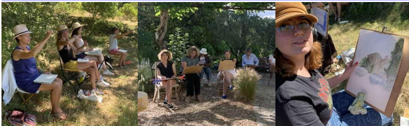
Photographies des précédents stages

En résidentiel : 750 € pour 1 personne (chambre simple), 1 100 € pour 2 personnes (chambre double, 1 ou 2 lits) tout compris, hébergement (4 salles de bains), pension et cours. Les stagiaires habitent La Molière, entre vignes, lavandes et bois de chênes, devant les monts du Lubéron.